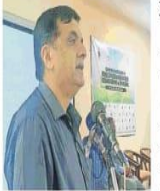
पुलिस लाइन में कार्यक्रम के दौरान जानकारी देते डी.आई.जी.।

पुलिस लाइन में कार्यक्रम के दौरान मौजूद पुलिस अधिकारी।