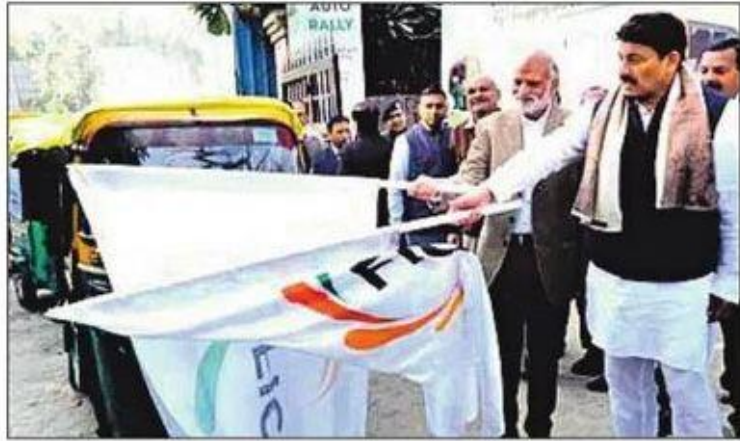
रैली को हरी झंडी दिखाते मनोज तिवारी।

फिक्की-कास्केड द्वारा तस्करी व जाली उत्पादों के खिलाफ जागरूकता बढ़ाने के लिए शनिवार को वार्षिक ऑटो रैली का तीसरा संस्करण आयोजित किया गया। रैली को सांसद मनोज तिवारी ने हरी झंडी दिखाई। रैली का उद्देश्य तस्करी कर लाए हुए एवं जाली उत्पादों के कारण भारत की अर्थव्यवस्था, सार्वजनिक स्वास्थ्य एवं राष्ट्रीय सुरक्षा पर पड़ने वाले दुष्प्रभावों को लेकर बड़े पैमाने पर