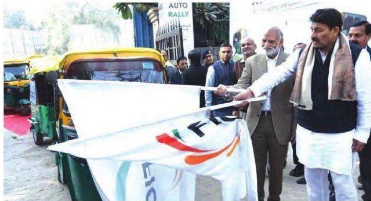
Manoj Tiwari, Member of Parliament and Anil Rajput, Chairman, FICCI CASCADE, flagging off the Anti-Smuggling Auto Rally in Delhi, with over 300 auto-rickshaws participating to raise awareness on the rising threat of smuggling and counterfeiting

"Smuggling is not just an economic offence, it is a silent threat that fuels criminal networks and even terrorism. A bomb blast shocks the nation in a single moment, but the funding for such acts often begins quietly through the sale of smuggled and illegal goods. Many citizens do not realise that when