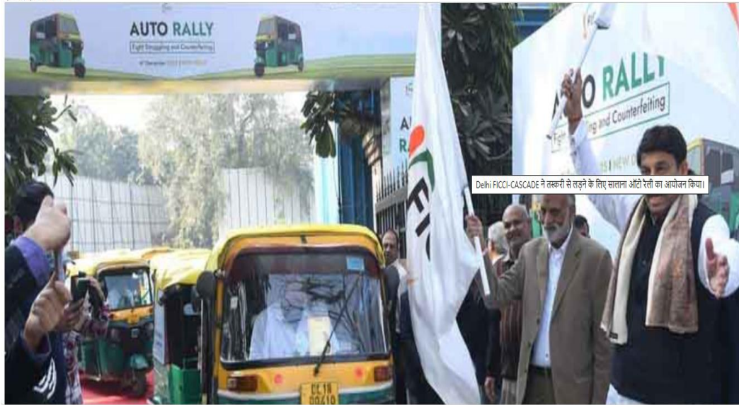
Delhi FICCI-CASCADE ने तस्करी से लड़ने के लिए सालाना ऑटो रैली का आयोजन किया।

By - Kunal | Update: 2025-12-07 09:26 GMT