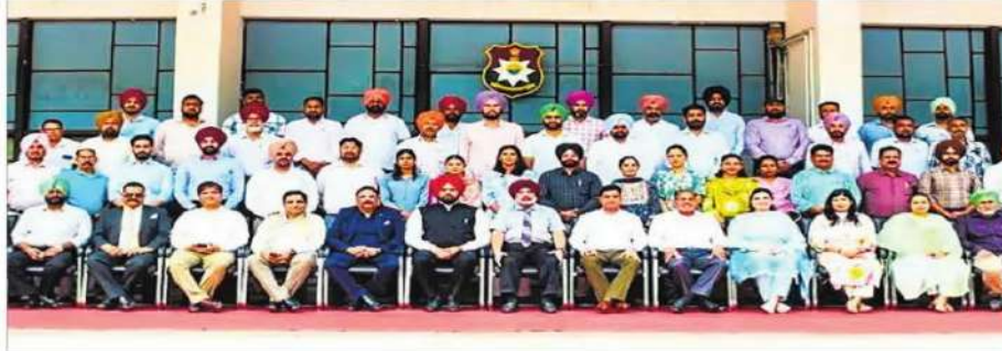
Senior police officials participate in a capacity-building programme at Phillaur in Jalandhar.