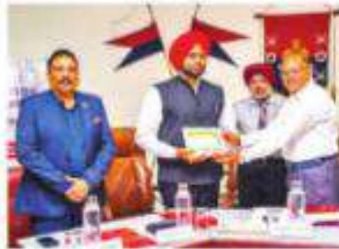
Punjab Special DGP Amardeep Singh Rai presenting a publication during FICCI-CASCADE session at Phillaur Police Academy.

Speaking at a session on 'Tackling counterfeiting and smuggling: Strategies for effective enforcement', organised by FICCI-CASCADE at the Police Academy in Phillaur, he said counterfeiting and smuggling not only undermine legitimate businesses and government revenues but also pose a serious threat to consumer safety and fuel illegal networks. He stressed that tackling these challenges requires robust enforcement,