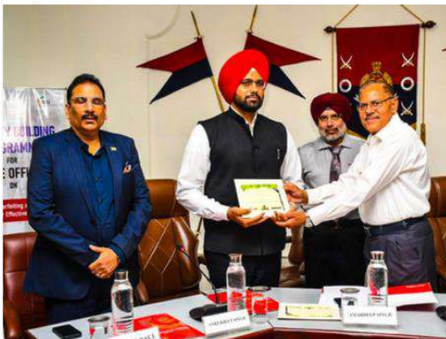
Stronger enforcement, stakeholder collaboration must for combating smuggling: Punjab Special DGP.