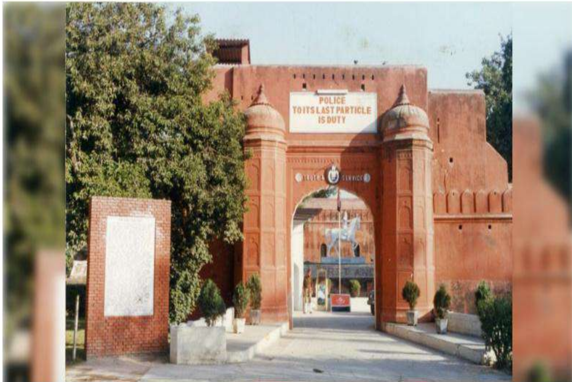
Police Academy in Phillaur: File photo

https://www.tribuneindia.com/news/jalandhar/punjab-police-vows-tougher-crackdown-on-counterfeiting-smuggling-at-phillaur-training/